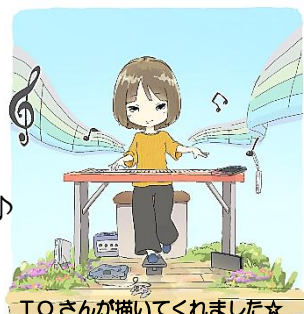
T.Oさんが描いてくれました女