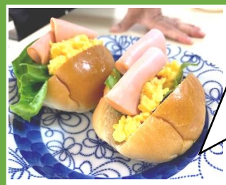
ランチ：ロールパンサンド

ゆったりと過ごす時間は誰にでも必要ではないでしょうか？メリハリのついた時間を過ごしたいです。