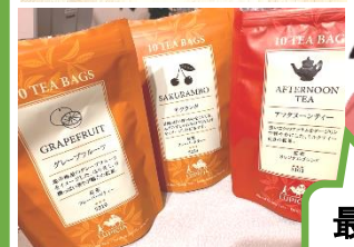
優雅なティータイム